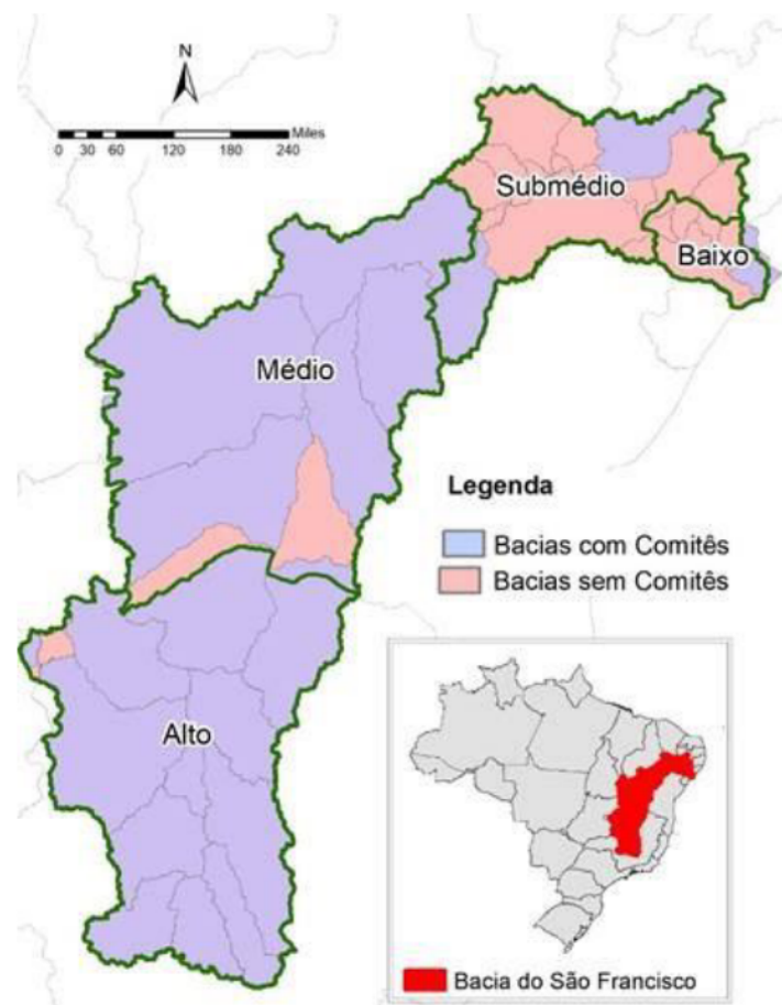
Figura 1. Divisão Fisiográfica da bacia hidrográfica do Rio São Francisco.

A bacia hidrográfica do São Francisco está localizada entre 7° e 21° de Latitude Sul e 35° a 47° de Longitude Oeste, abrangendo 639.219 km 2 , com vazão média registrada em 2018, de 1.311,00 m 3 /h que chegam ao oceano Atlântico 1 . Sendo composta pelo leito principal, por 34 sub-bacias, por 168 afluentes e dividida em quatro regiões fisiográficas: Alto São Francisco, com 16% da área da bacia; Médio São Francisco, com 63% da área da bacia; Submédio São Francisco, com 17% da área da bacia; e Baixo São Francisco, com 4% da área da bacia (SANTANA, 2010), como mostra na Figura 1.