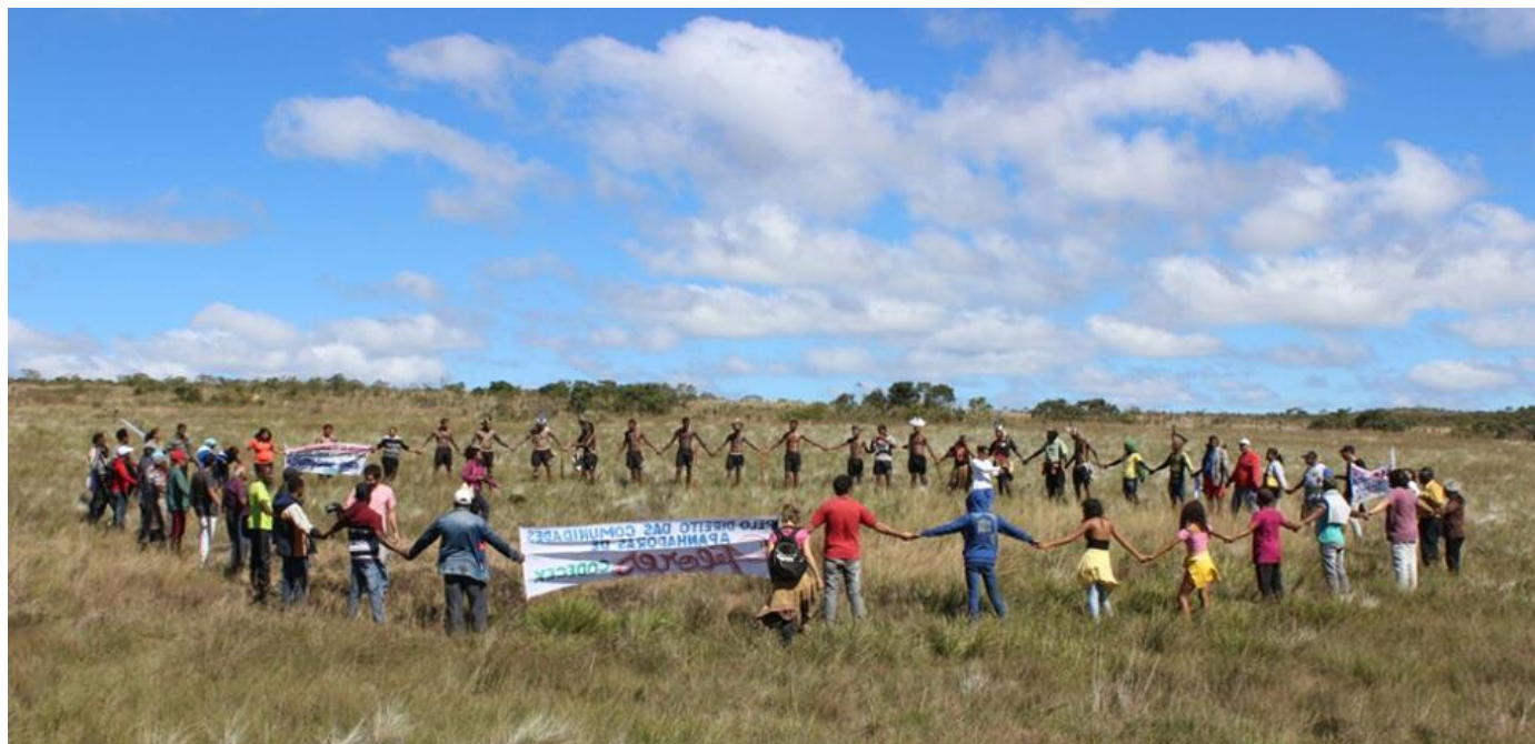
Imagen 1 - Fiesta de la panha de flores, Comunidad de Macacos.

Una de las luchas de las comunidades de recolectores de flores es la recategorización del Parque Nacional Siemprevivas a Reserva de Desarrollo Sostenible (RDS). A través de la incidencia política, la CODECEX logró constituir un Grupo de Trabajo (GT) para brindar soluciones al conflicto con el parque. El día que el GT presentó la propuesta de recategorización, la Articulación Rosalino organizó el envío de un ómnibus con líderes geraizeiros para que estuvieran presentes en el evento. El Consejo recibió el informe y aprobó por amplia mayoría la moción de apoyo a la propuesta de recategorización del parque a RDS. Y, en 2017, durante la lucha para que las comunidades pudieran retomar las actividades de recolección de flores siemprevivas en las praderas que habían sido abarcadas por el Parque, la Articulación Rosalino envió un ómnibus con jóvenes guerreros del pueblo Xakriabá, que partió de São João das Missões y completó los asientos vacíos con representantes de vazan-teiros , geraizeiros y quilombolas . Después de más de 10 años de no poder realizar la recolección ( panha ) de flores, ese día, partiendo desde Macacos, una de las comunidades más debilitadas, con un gran esfuerzo colectivo se pudo realizar la panha de flores. Luego, todos celebraron en el centro de la pradera.