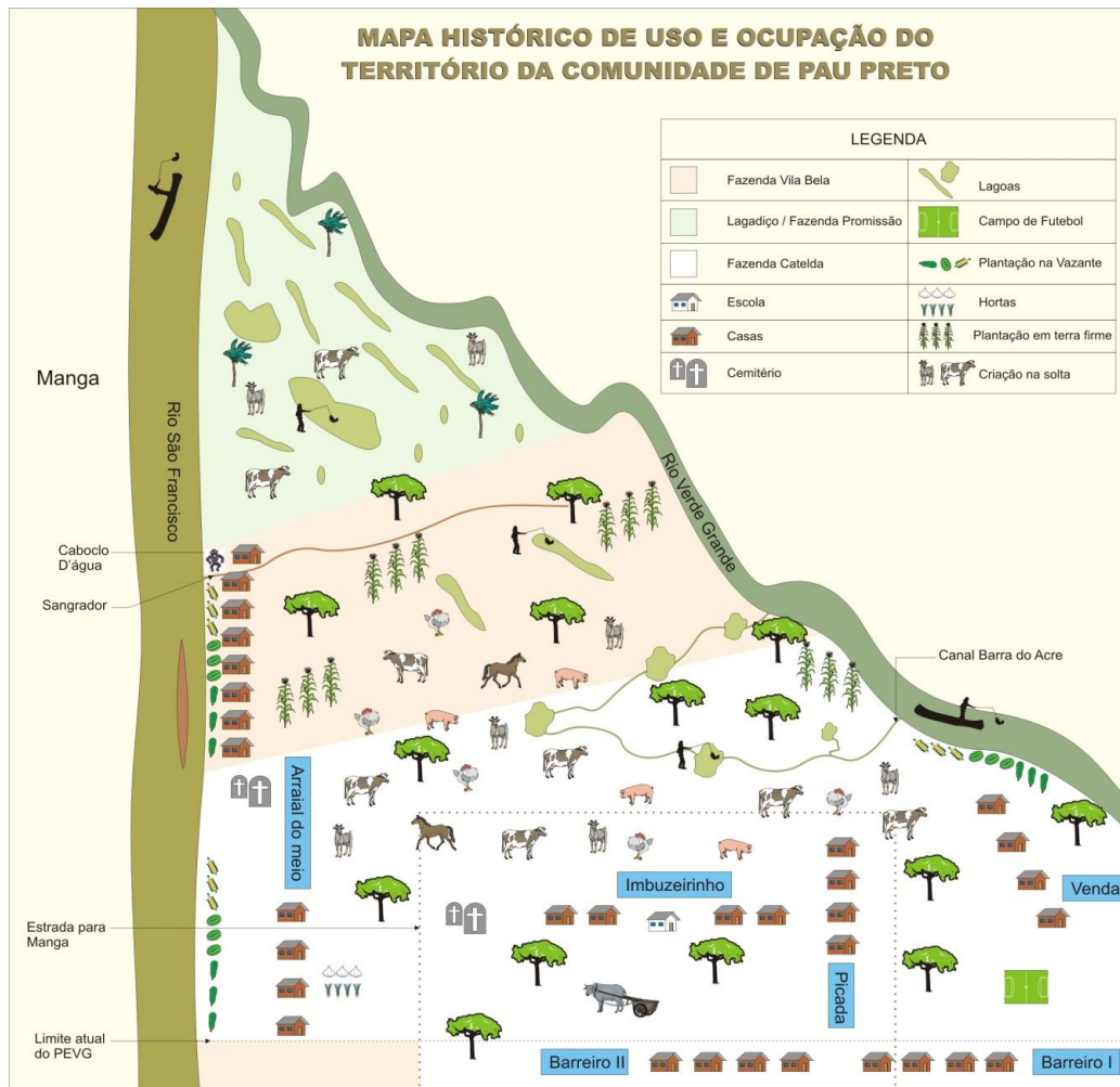
Mapa 2 – Mapa hablado de la Comunidad de Pau Preto – Fuente: Anaya, 2010

propuesta de uso y ocupación de los terrenos de acuerdo con la lógica vazanteira . Siguiendo las experiencias de las comunidades geraizeiras , en 2011, los vazanteiros llevaron a cabo la recuperación del territorio con la ocupación de la Fazenda Catelda , cuyas instalaciones se asentaron sobre la antigua comunidad de Arraial do Meio. Además de la recuperación, también realizaron la autodemarcación del territorio y apostaron a un nuevo modelo de regularización, como el Proyecto de Asentamiento Agroextractivista.